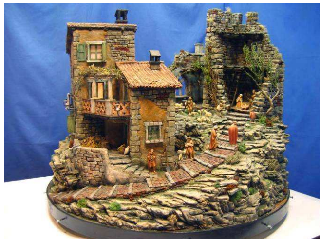
Umberto Palazzo – Rossella Lolli